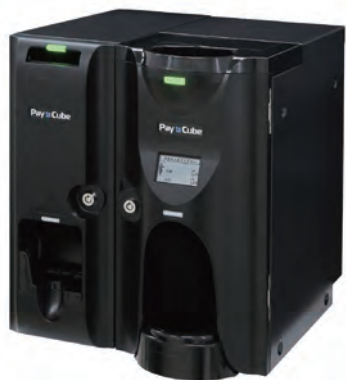
製品名: PayCube 製造元: 株式会社日本コンラックス